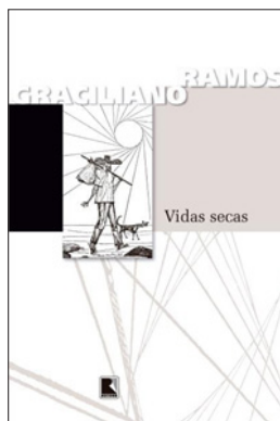
Vidas secas GRACILIANO RAMOS Editora Record ISBN: 8501067342