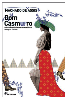
Dom Casmurro MACHADO DE ASSIS Coleção Travessias Editora Moderna ISBN: 9788516096892