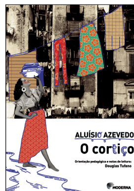
O cortiço ALUÍSIO AZEVEDO Coleção Travessias Editora Moderna ISBN: 9788516096915