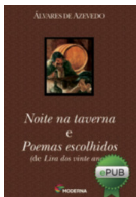
Noite na taverna e poemas escolhidos ÁLVARES DE AZEVEDO Editora Moderna ISBN: 9788516076856