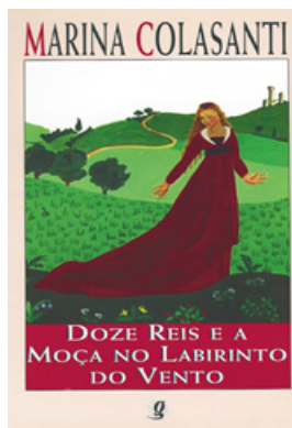
Doze Reis e a Moça no Labirinto do Vento MARINA COLASANTI Editora Global ISBN: 8526011081