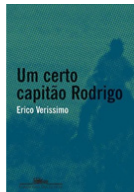
Um certo capitão Rodrigo ERICO VERISSIMO Companhia das Letras ISBN: 9788535905984